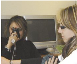
Un essai de médicament contre une affection ORL, réalisé sur une jeune femme volontaire.

Bien que nombreux, les volontaires (pour la plupart des personnes sans emploi ou étudiantes) manquent constamment, en raison d'un turn over