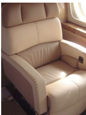
5 selliers, 2 mécaniciennes et 2 coupeurs formés sur place, travaillent à l'habillage des sièges d'avions

Hamache réalise les housses et mousses de sièges, découpe les moquettes, habille les panneaux des gros porteurs. Et dans un registre plus « travaillé », l'entreprise collabore avec des designers pour concevoir des cabines d'exception dont les détails sont parfois d'un luxe surprenant. « Ce sont deux métiers différents. Pour les gros porteurs, il faut avoir de bons prototypistes. Pour les jets, il s'agit d'un vrai travail de sellier, car nous recherchons une très grande qualité. »