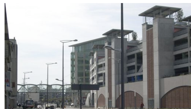
Le quartier de la gare fait peau neuve ; un centre d'affaires et de conférences et de nouvelles entreprises prennent place, mais doucement.

Les habitants du quartier voient d'un autre oeil la transformation de leur secteur. La difficulté de trouver des stationnements gratuits, des travaux qui s'éternisent, le manque d'esthétisme sont différents points récurrents sur les retours faits par les résidents. Certains commerçants aussi grincent des dents : « le mauvais agencement des places de stationnement ne