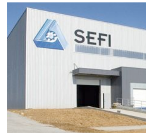
SEFI s'est rendu propriétaire de ce bâtiment prêt pour la fin mars 2009

Développement oblige, l'entreprise délocalise ses deux zones de stockage poitevines et celle de Rennes pour les regrouper sur un seul et même site : la zone St Nicolas, qui offre de la place pour s'agrandir. Un bâtiment de 5 600 m 2 sur un terrain de 36 000 m 2 .