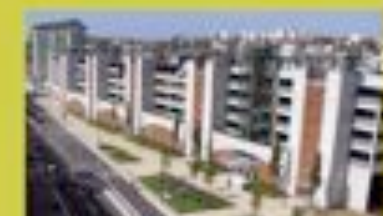
PÔLE MULTIMODAL GARE DE POITIERS